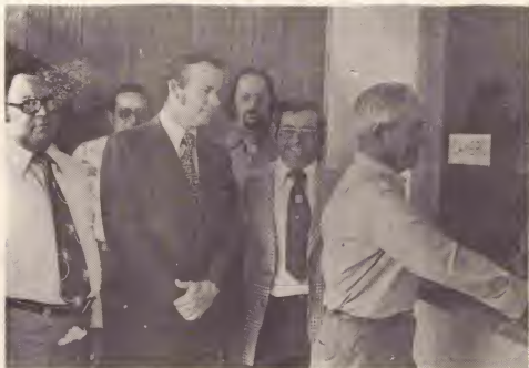
Sucursal nobo di Eilandsontvanger den e pueblo di Santa Cruz.

Durante e ultimo tres añanan y mei Gobierno Insular a mira e necesidad di mehora varios servicionan pa pueblo en general.